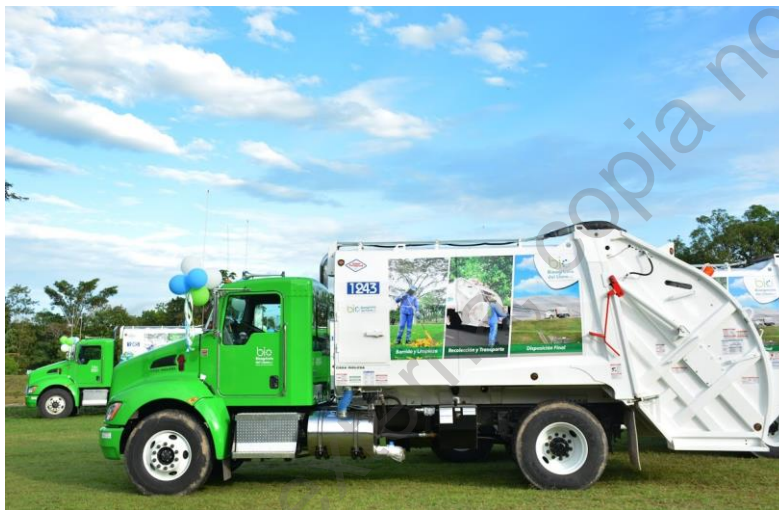
Ilustración 1. Vehículo recolector de residuos ordinarios.

Bioagrícola del Llano cuenta con una flota de 23 vehículos recolectores tipo compactador de entre 16 y 25 Yd 3 , los cuales son utilizados para la recolección de residuos ordinarios. Para la recolección de los grandes generadores, se hace uso de contenedores de 3 y 5 yardas cúbicas, para lo cual, el cincuenta por ciento de los vehículos cuenta con el sistema de recolección de contenedores de 3 yardas y para la recolección de contenedores de 5 yardas cúbicas, se tiene un vehículo tipo Ampliroll.