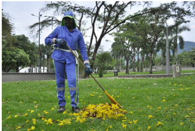
Ilustración 2. Actividad de Barrido y Limpieza 1

Actualmente se presta el servicio de Barrido con una cobertura del 98% sobre el municipio. Bioagrícola del Llano se encuentra en constante actualización de las nuevas urbanizaciones y localidades con el fin de mantener o incrementar dicha cobertura. De esta manera, Bioagrícola del Llano SA ESP, proyecta los kilómetros a incrementar en el municipio, siempre y cuando la cantidad sea significativa e implique la contratación o ampliación de la mano de obra existente acorde con el crecimiento de vías en el municipio.